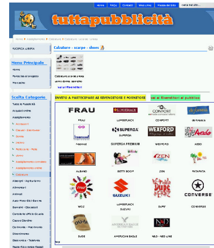
Scarpe uomo e donna, clicca

A queste richieste degli Internauti rispondono nelle primissime posizioni dei motori di ricerca – in via permanente - le pagine visibilità della Comunità Commerciale www.tuttapubblicita.it che promuovono lo stesso argomento informando e segnalando i negozi di Calzature delle stessa città dove rivolgersi per acquistare le Scarpe ricercate