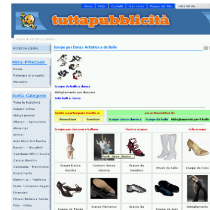
Scarpe da ballo, clicca