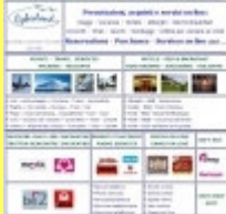
Pagine visibilità statiche

Il Rivenditore che non vuole gestire autonomamente il sito utilizza le "pagine visibilità" statiche, che producono reddito. Le pagine diventano "sito fai da te" in qualsiasi momento