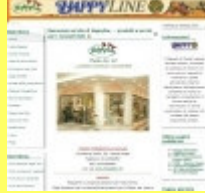
Sito fai da te autogestibile

Il Rivenditore che vuole la gestione autonoma è dotato del "sito fai da te" disponibile in varie soluzioni per realizzare attività a valore aggiunto