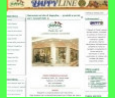
Pagine Promozionali Rivenditore

I Fornitori Primari partecipanti al progetto "visibilità per vendere" determinano l'interesse all'acquisto dei clienti consumatori tramite i siti web degli stessi Rivenditori che devono necessariamente essere informati sui Distributori territoriali (Grossisti) dove rifornirsi dei prodotti pubblicizzati