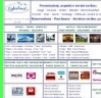
Pagine Promozionali Rivenditore

I prodotti pubblicati sul web sono visibili dai clienti internauti e dai Rivenditori tramite le pagine visibilità" ed i "siti fai da te" degli stessi Rivenditori ed i portali tematici del settore. Promuovono l' aumento delle vendite con la pubblicità dei prodotti ai consumatori e l'informazione ai Rivenditori